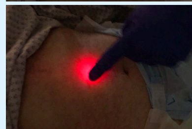
Images 2+3 : lumière de l'endoscope pendant la diaphanoscopie en préparation de la PEG